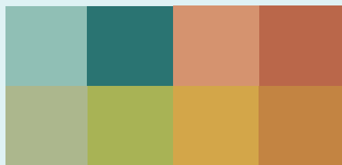
Sélection de couleurs retenue pour la Maison des aînés Maisonneuve

L'initiative a permis aux résidents et aux employés de contribuer activement à l'aménagement de leur environnement, un gage de l'engagement envers leur nouveau milieu de vie.