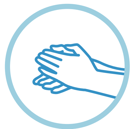
Hygiène des mains