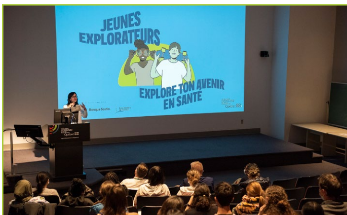
Photos : Événement Jeunes explorateurs

Enfin, rappelons que le succès du programme Explore ton avenir en santé , repose grandement sur le travail de collaboration avec toutes les équipes du terrain et la mobilisation de l'ensemble du personnel du CIUSSS-EMTL pour accueillir à bras ouverts les personnes intéressées par les professions métiers de la santé et des services sociaux. ●