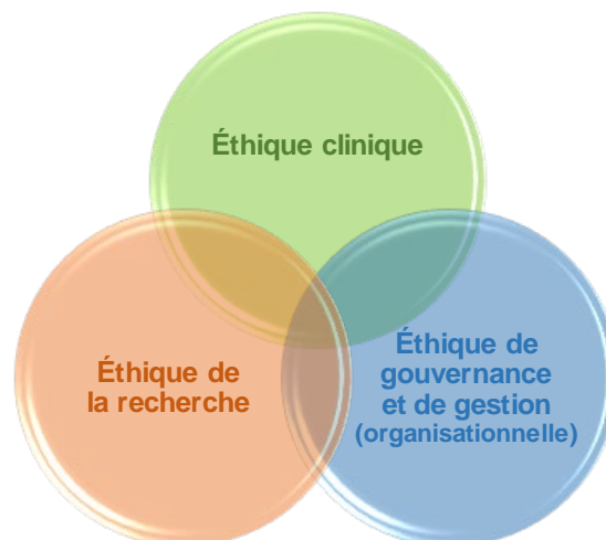
Figure 2. Secteurs de l'éthique dans une organisation

Dans une organisation de santé et de services sociaux, l'éthique englobe plusieurs secteurs dont l'éthique de gouvernance et de gestion, l'éthique clinique et l'éthique de la recherche. Ces différents secteurs sont en interrelation et des liens étroits entre eux doivent être assurés par les mécanismes développés par l'organisation (cf. figure 2).