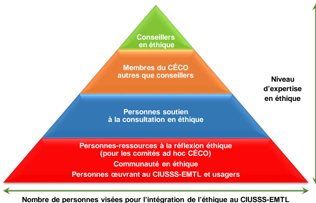
Figure 3. Représentation de la communauté en éthique du CIUSSS-EMTL

La banque de personnes-ressources à la réflexion éthique sont celles qui démontrent un intérêt certain pour l'éthique, qui ont idéalement suivi la formation de base et qui souhaitent contribuer à des réflexions dans les groupes ad hoc à une moindre fréquence que les personnes soutien à la consultation. Les personnes-ressources sont volontaires, convoquées au moins une par année pour des analyses et des réflexions et font partie de ce que nous appelons la communauté éthique . Les activités et la communauté ainsi créées permettent de déployer l'éthique dans l'ensemble de l'organisation.