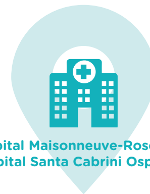
Hôpital Maisonneuve-Rosemont Hôpital Santa Cabrini Ospedale

CHSLD Jeanne-Le Ber : tous les espaces extérieurs 2 sont sans fumée à l'exception des Zones fumeurs réservées aux usagers et aux visiteurs. Fermeture graduelle des fumeurs jusqu'à décroissance complète du nombre de résidents fumeurs.