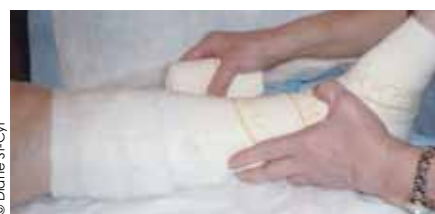
Système élastique 2 couches avec indicateurs visuels : les indicateurs rectangulaires permettent d'obtenir le bon niveau d'extension. La ligne facilite un chevauchement de 50% du bandage élastique. (Surepress MC )