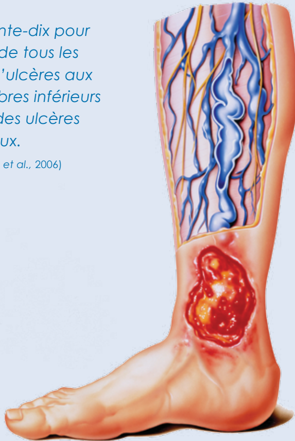
Grand ulcère veineux situé à la malléole interne, bords irréguliers. En bleu, les veines variqueuses dilatées résultant de l'hypertension veineuse.

Ils touchent les femmes dans une proportion de 62 %. Dans 22 % des cas, le premier ulcère se développe avant l'âge de 40 ans, et dans 72 %, avant l'âge de 60 ans (OIIQ, 2007). De plus, 72 % des clients auront un ulcère récurrent, ce qui démontre l'importance de la thérapie de compression à vie (Sibbald et al. , 2007).