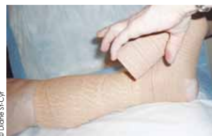
Système inélastique 2 couches. (3M Coban 2 MC )