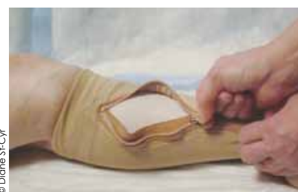
Bas de compression avec fermeture éclair, plus facile à enfilier. (JOBST UlcerCare MC )

« Mesuré à l'aide d'un appareil d'ultrasonographie ( doppler ) muni d'une sonde de 8 MHz (5 MHz pour les clients obèses), l'IPSCB consiste à diviser le résultat de la pression systolique de la cheville par celui de la pression systolique brachiale » (OIIQ, 2007). Le Tableau 3 présente l'interprétation des résultats de l'IPSCB, selon Burrows et al. (2006).