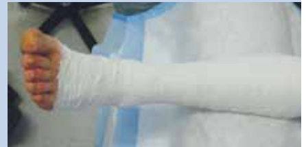
Appliquer de la base des orteils en montant sous le genou avec chevauchement de 50 %. Le séchage rend le bandage semi-rigide (Viscopaste MC ).