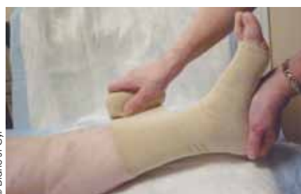
Bandage à faible élasticité. (Comprilan ® )