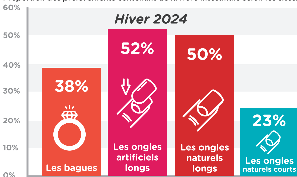
Proportion des prélèvements contenant de la flore intestinale selon les sites.

35 % des prélèvements contenaient des bactéries habituellement retrouvées dans la flore intestinale pouvant potentiellement entraîner des infections, dont les Enterococcus faecalis et l' Escherichia coli .